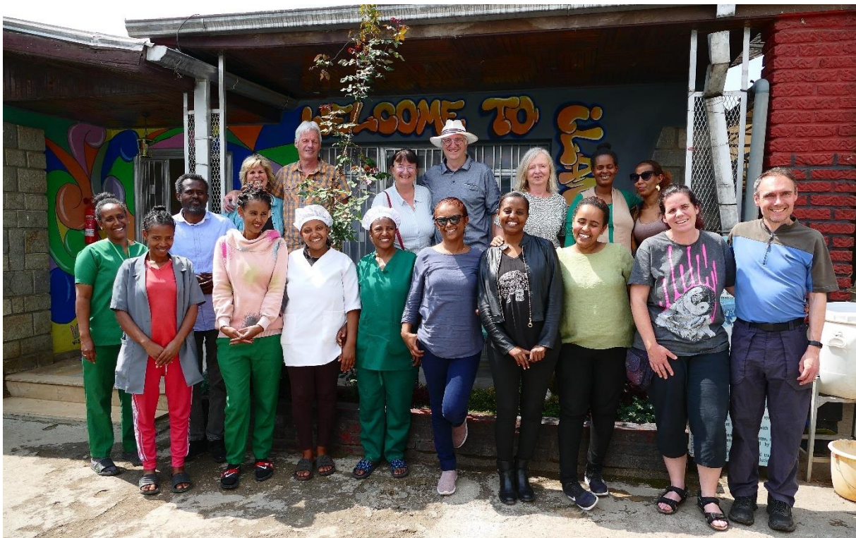
Besuch aus der Schweiz im ilanga-Center.