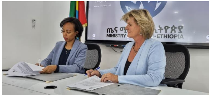
MoU mit Gesundheitsministerin Dr. Lia Tadese.