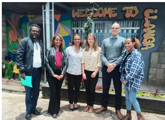
Besuch der CH-Botschaft bez. der «Small Action Fond»-Spende.