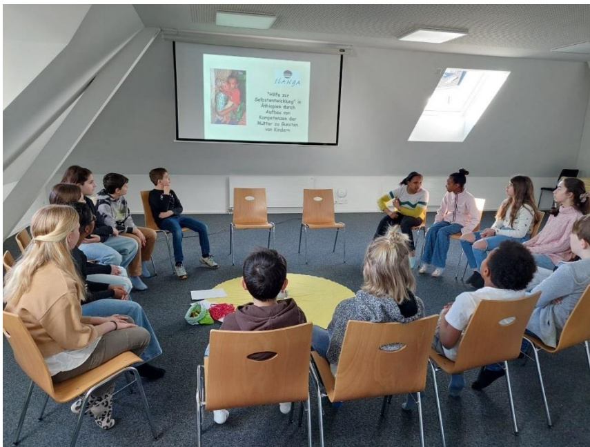
Fastenopferaktion mit der Kirchgemeinde Reussbühl/LU.

Speziellen Dank geht an die Stiftung Zuversicht für Kinder, die den Aufbau des Zentrums «Confidence for Children» massgeblich ermöglicht hat.