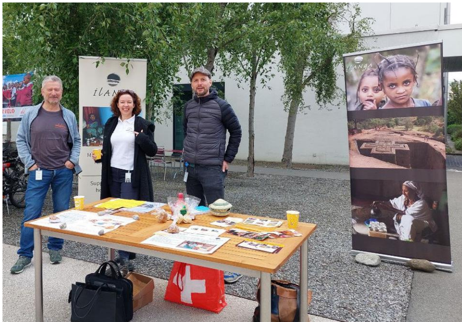
Teilnahme am Velafrika-Tag bei Roche Diagnostics

Es wird nicht einfach sein das benötigte Geld zu beschaffen wir sind dankbar für jede Unterstützung. (Spenden, Netzwerk zu Stiftungen, Organisationen, Institutionen, Aktivitäten- Vermittlung / - Organisation, freiwilligen Arbeit, Reiseteilnahme etc.)